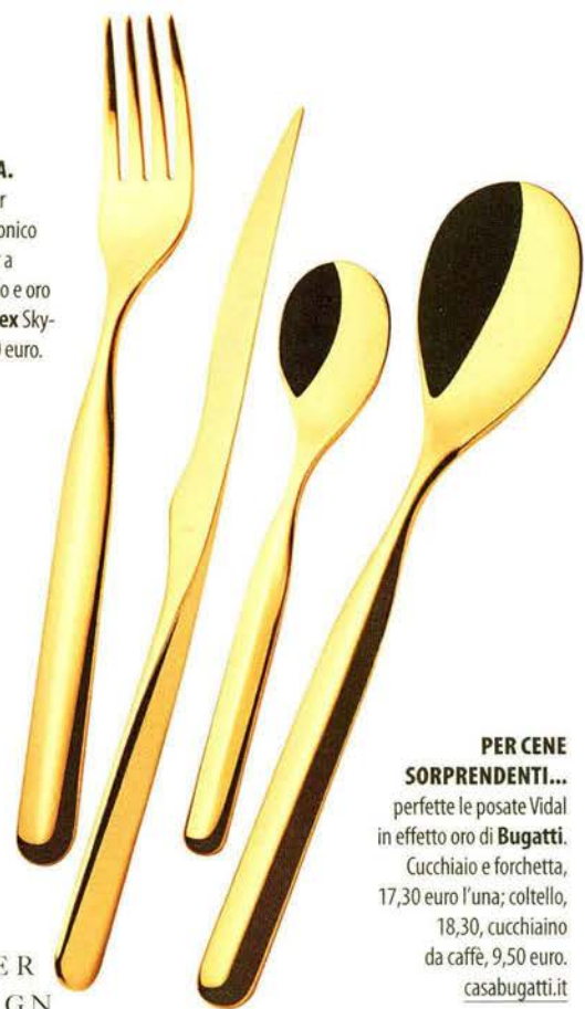
PER CENE SORPRENDENTI... perfette le posate Vidal in effetto oro di Bugatti. Cucchiaino e forchetta, 17,30 euro l'una; coltello, 18,30, cucchiaino da caffè, 9,50 euro. casabugatti.it