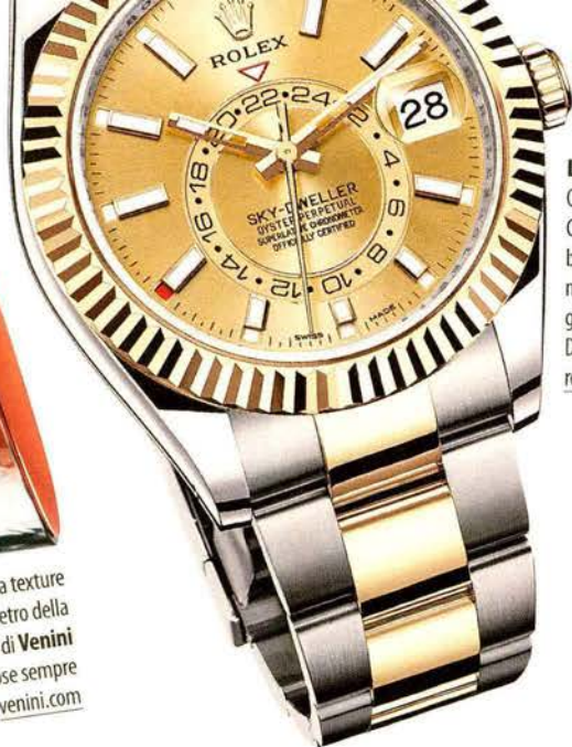
L'ORA GIUSTA. Quadrante color Champagne, iconico bracciale oyster a maglie in acciaio e oro giallo per il Rolex Sky-Dweller. 15.900 euro. rolex.com