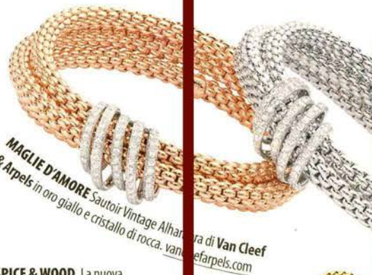
MAGLIE D'AMORE Sautoir Vintage Alhambra di Van Cleef & Arpels in oro giallo e cristallo di rocca. vancliefarpels.com