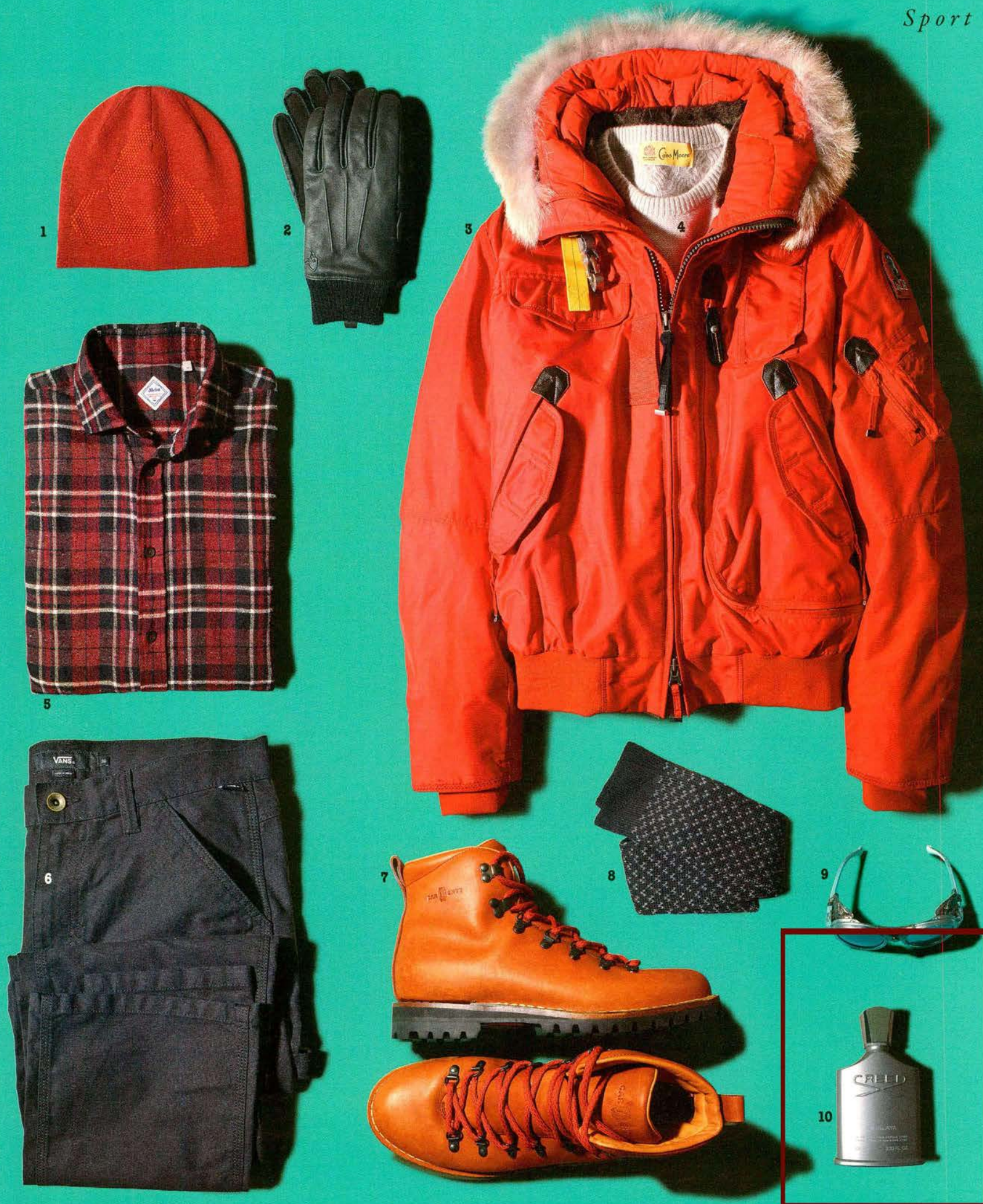
1. ODLO. Cappello in lana rosso. 33 euro, odlo.com . 2. NORRONA. Guanto in pelle e camoscio interno in materiale tecnico "PRIMALOFT". 139 euro, norrna.com . 3. PARAJUMPERS. Bomber in piuma d'oca in tessuto tecnico waterproof multi tasche con cappuccio removibile e interno staccabile. 785 euro, parajumpers.it . 4. CAINS MOORE. Maglia in puro cashmere pari collo con dettaglio losanghe sulla parte alta del capo. 380 euro, cains-moore.it . 5. XACUS. Camicia limited edition a quadri sui toni del bordeaux e nero, bottoni in madreperla. A partire da 120 euro, xacus.com . 6. VANS. Pantalone in cotone tipo da lavoro. 75 euro, vans.com . 7. CAR SHOE. Boot da montagna con alta suola in gomma, stringhe e ganci tipo roccia. 490 euro, carshoe.com . 8. GALLO. Calza in lana e seta jacquard tipo cravatteria. 40,50 euro, thecartogallo.it . 9. MONCLER LUNETTES. Occhiali da scalatore Himalayano in acetato silver e lente a specchio. 320 euro, moncler.com . 10. CREED: HIMALAYA. Note legnose e musciate e note calde di vetiver. 218 euro, creed.it