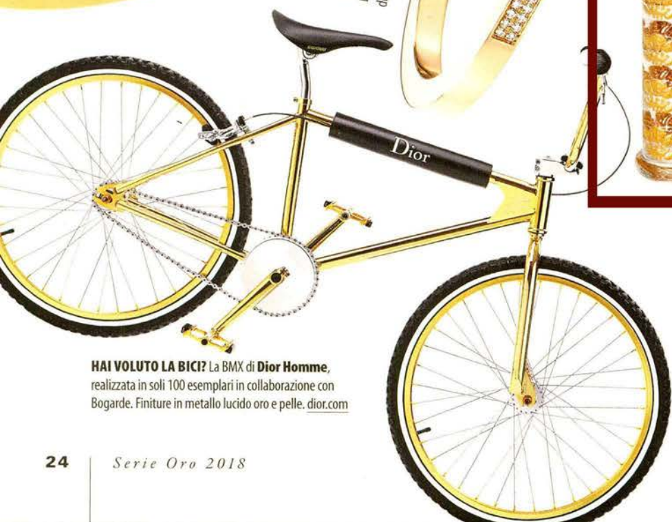
HAI VOLUTO LA BICI? La BMX di Dior Homme, realizzata in soli 100 esemplari in collaborazione con Bogarde. Finiture in metallo lucido oro e pelle. dior.com