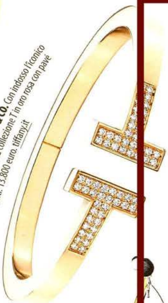
COLAZIONE DA... TIFFANY & CO. Con indosso l'iconico bracciale Square della collezione T in oro rosa con palette di diamanti. 13.800 euro. tiffany.it