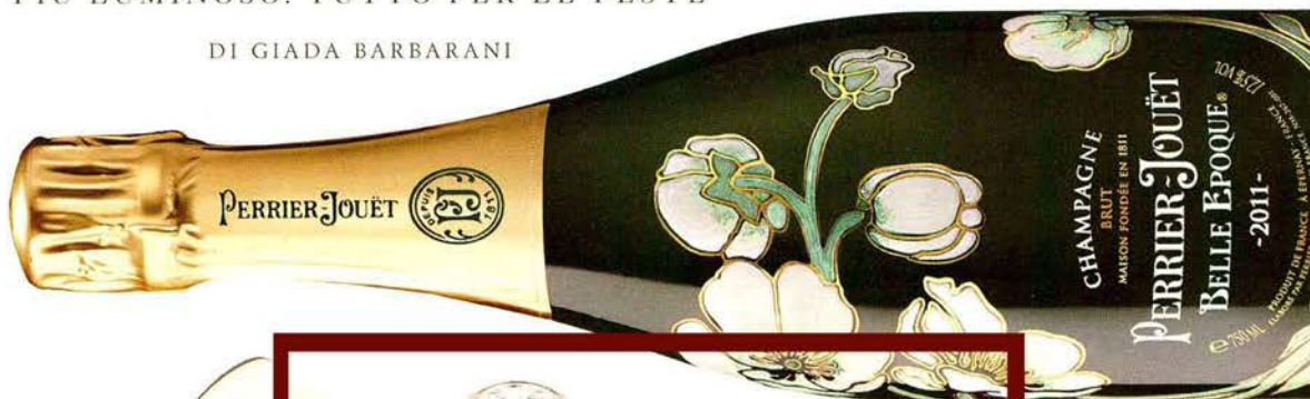
UN'OTTIMA ANNATA. Champagne Perrier-Jouët Cuvée Belle Époque 2011, un'annata armoniosa. Per brindare al nuovo anno! perrier-jouet.com