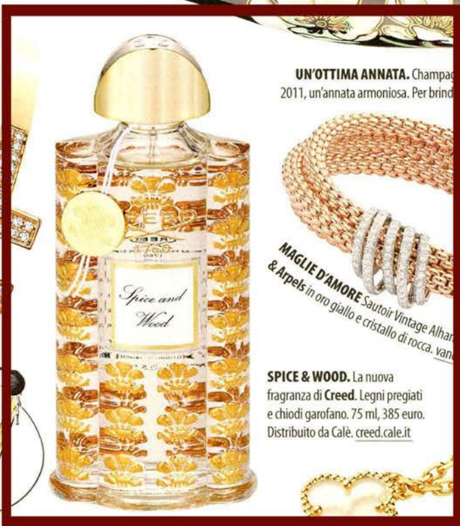
SPICE & WOOD. La nuova fragranza di Creed. Legni pregiati e chiodi garofano. 75 ml, 385 euro. Distribuito da Calé. creed.cale.it